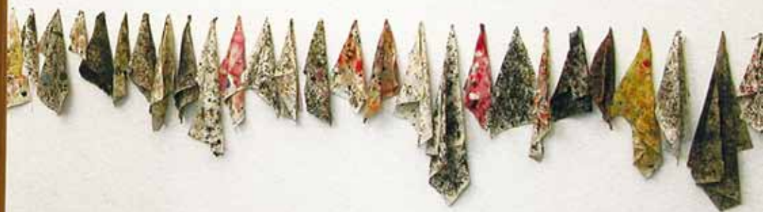
Les documents du S.T.P. en collaboration avec André Bertrand, Jacques Charlier, 1979, Collectie S.M.A.K., foto: Dirk Pauwels