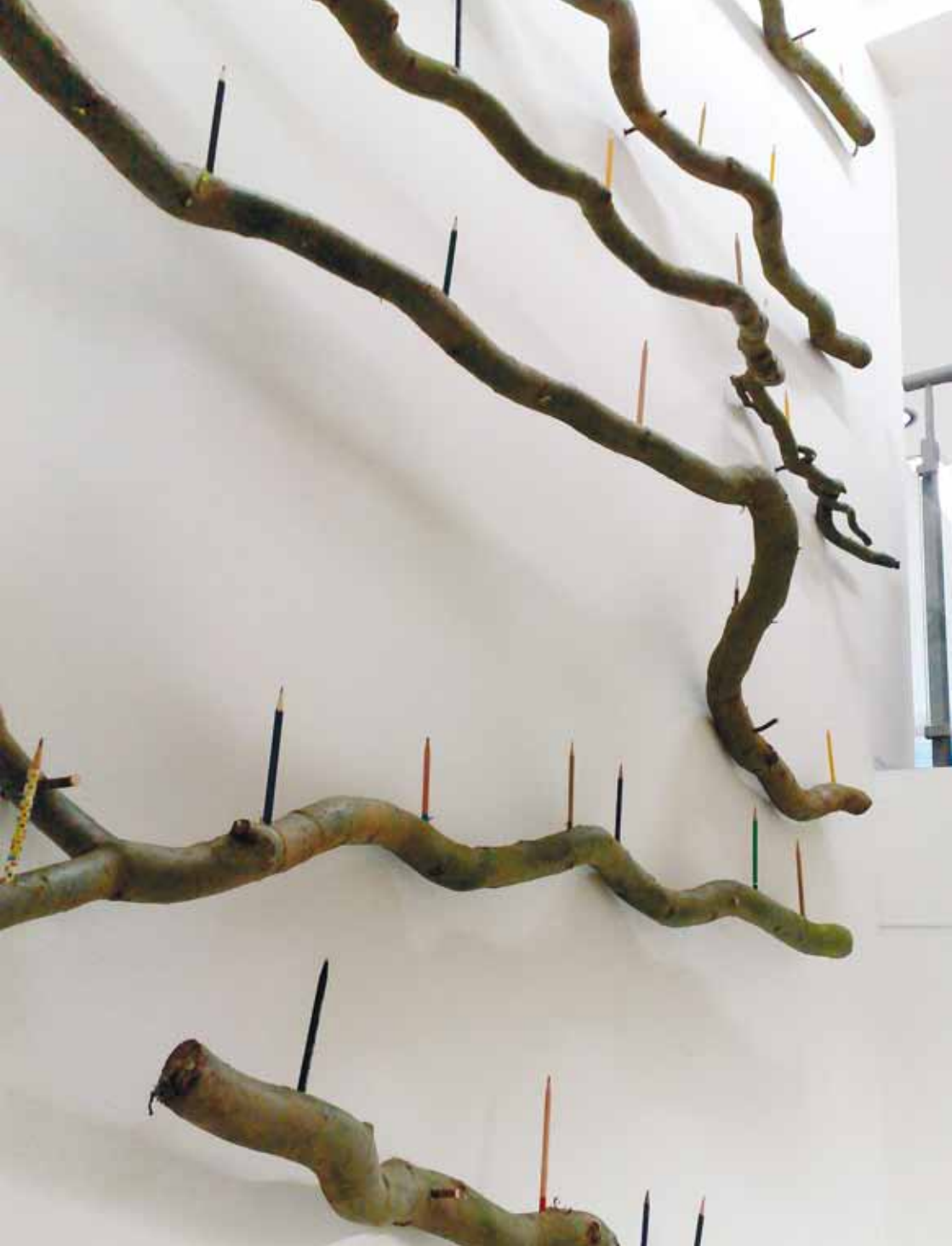
Petits cris de joie , Piet Dirckx, 2009